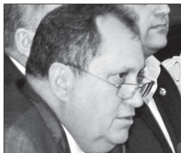
Radu Podgorean, Secretarul de Stat al Ministerului de Externe al României:

aderare și participare în cadrul diverselor organizații internaționale sunt aspecte foarte importante. Înțelegând existența unui potențial considerabil și neexplorat până în prezent în relația colectivităților locale din cele două state, precum și experiența deosebit de valoroasă a colectivităților locale din România, să facem tot ce ne stă în putință în vederea implementării corespunzătoare în țările noastre a stardardelor europene în domeniul descentralizării și autonomiei locale. Inclusiv, prin intermediul dezvoltării relațiilor directe între comunitățile locale. Profitând de ocazie, din partea președintelui Republicii Moldova, Nicolae Timofti, vă urez într-un ceas bun, succese și realizări frumoase pentru binele dezvoltării comunităților locale din țările noastre”.