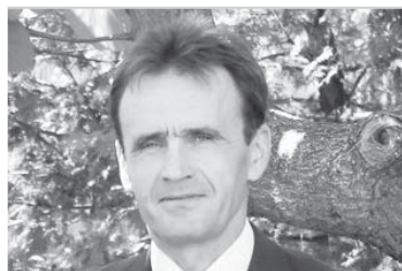
Lurie Tap, președintele Comisiei Parlamentare Speciale pentru Decentralizarea și Consolidarea Autorităților Publice Locale:

Discuțiile din cadrul reuniunii s-au axat pe analiza situației și a priorităților din domeniul descentralizării și autonomiei locale din România și Republica Moldova. Reprezentanții autorităților locale din cele două state au convenit asupra unui set comun de acțiuni pentru perioada următoare, care să contribuie la stabilirea de parteneriate și modernizarea administrației locale la standarde europene.