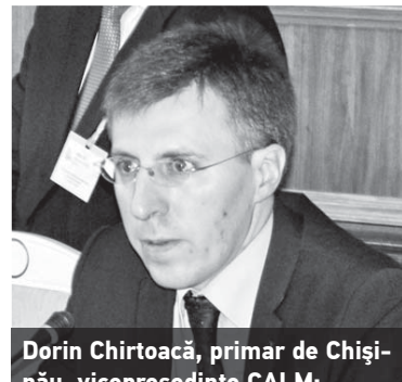
Dorin Chirtoacă, primar de Chișinău, vicepreședinte CALM:

că sunteți actori foarte importanți. De altfel, Constituția Republicii Moldova spune foarte clar că autoritățile publice locale sunt cele care urmează să realizeze autonomia locală sau să apere drepturile și interesele colectivităților locale. Aș zice, este, de fapt, și un exemplu important pentru structurile noastre centrale, pentru Parlamentul și guvernul Republicii Moldova și, respectiv, al României. Și asta, pentru că anume lor le este caracteristică stabilirea podurilor nu doar de flori, dar punți reale de cooperare care să permită mai departe autorităților locale să valorifice din plin aceste posibilități”, a declarat Lurie Tap, președintele Comisiei Parlamentare Speciale pentru Decentralizarea și Consolidarea Autorităților Publice Locale.