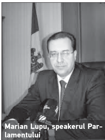
Marian Lupu, speakerul Parlamentului

În același timp, CALM face apel către toate formațiunile politice să se abțină de la participarea la acest eveniment și de la orice acțiuni care ar putea periclita caracterul strict profesional și apolitic al acțiunii date.