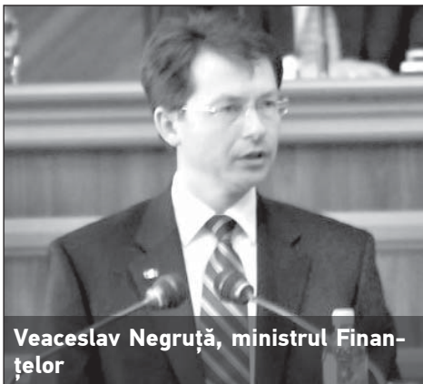
Veaceslav Negruță, ministrul Finanțelor

Proiectul nu a trecut fără scandal în Parlament. Modificările la Legea cu privire la Finanțele publice locale au stârnit nemulțumiri în rândurile deputaților, care au revizuit legea ce ține de bugetele autorităților publice locale. Potrivit ministrului Finanțelor, Veaceslav Negruță, care a prezentat proiectul de lege de la tribuna Legislativului, mecanismele și cadrul legal existente astăzi îngreunează și fac dependente de factorul uman relațiile între bugete de diferit grad: