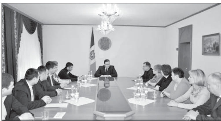
CALM, în cadrul întâlnirii cu M. Lupu, speakerul Palamentului

Chișinău, 1 februarie 2013 – Președintele Parlamentului Republicii Moldova, Marian Lupu, a avut astăzi o întrevedere cu o delegație a Congresului Autorităților Publice Locale (CALM). Întâlnirea a avut loc la inițiativa Președintelui Parlamentului.