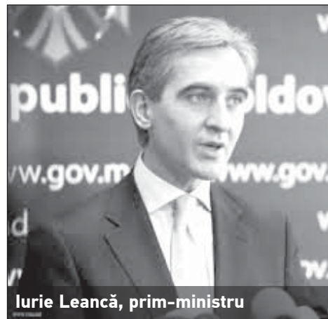
Lurie Leancă, prim-ministru

D-le prim-ministru, Strategia națională de descentralizare a fost adoptată anul trecut, în luna aprilie. Cum decurge realizarea Strategiei? Se regăsește domeniul respectiv printre prioritățile Guvernului pe care îl conduceți?