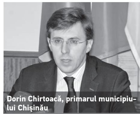
Dorin Chirtoacă, primarul municipiului Chișinău

rului de Chișinău, respectivele modificări ale legislației vor impulsiona activitatea APL și vor aduce revirimentul atât de mult așteptat. Totodată, Legea ar trebui revizuită, deoarece în municipiul Chișinău aplicarea acesteia, în forma ei actuală, ar determina un prejudiciu la buget de circa 1,7 miliarde lei.