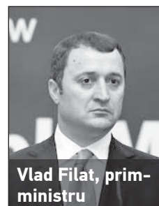
Vlad Filat, prim-ministrul

„NOI NU SUNTEM ÎN BĂRCI DIFERITE, SARCINA ESTE UNA COMUNĂ”