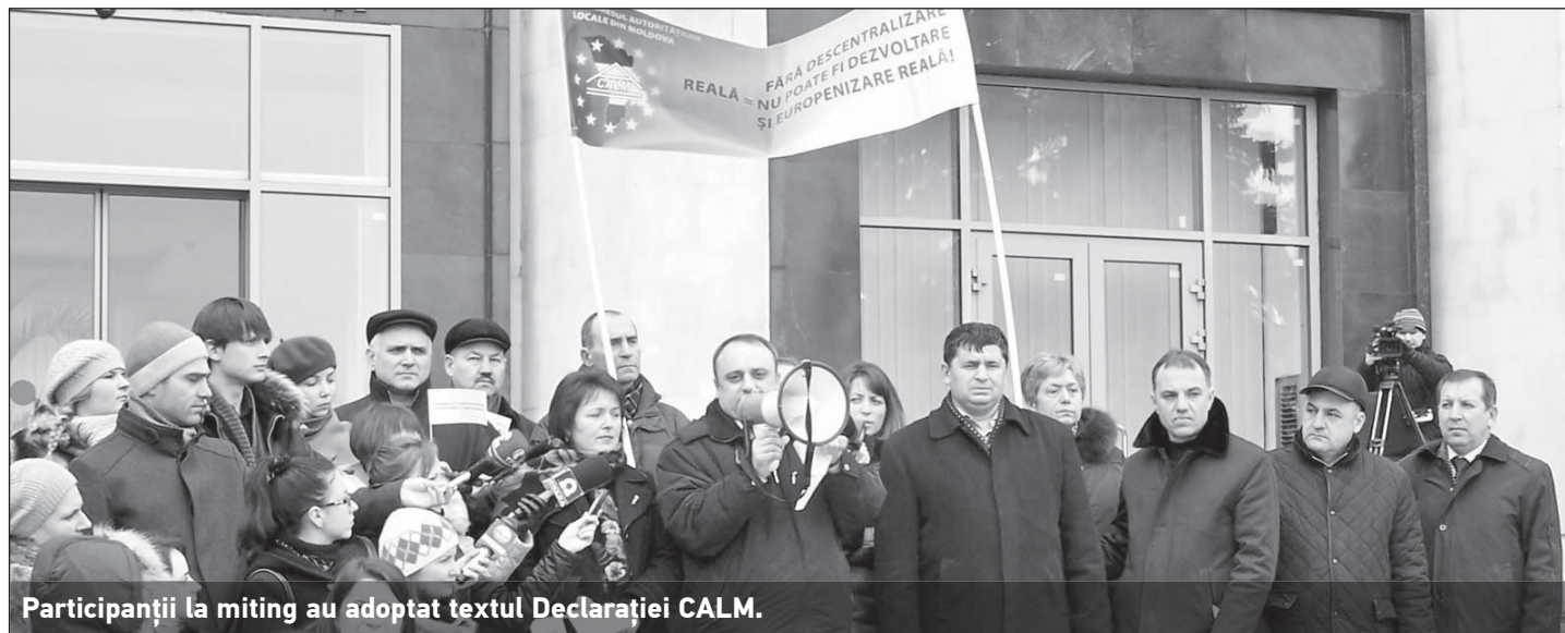
Participanții la miting au adoptat textul Declarației CALM.

În Declarația CALM, participanții au cerut autorităților centrale promovarea mai activă a descentralizării; implicarea primarilor în procesul decizional, prin stabilirea unui dialog instituțional permanent și efectiv între CALM, Guvern și Parlament; adoptarea în regim de urgență a proiectelor de legi privind finanțele publice locale și a celor ce prevăd transferul de competențe către APL în domeniul schimbării destinațiilor terenurilor agricole și accesul instituționalizat la justiția constituțională a APL, precum și stoparea controalelor abuzive asupra APL.